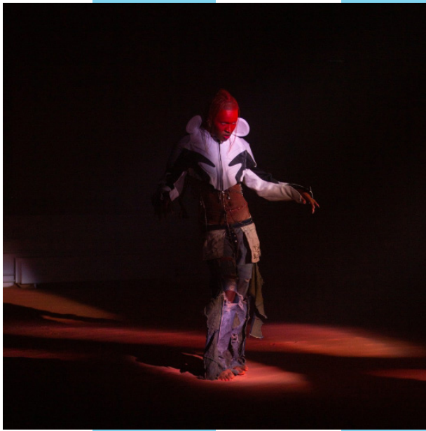
Starfire: Paraphernalia av Suutoo, utställning och performance.