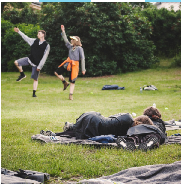
Läst till hälften av Malin Elgán, del av Lustholmen. Foto: Sima Korenivski.