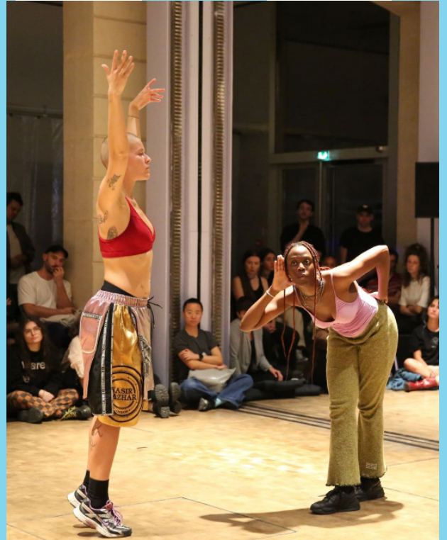
Unending love, or love dies, on repeat like it's endless av Alex Baczynski-Jenkins. Del av festivalen Amarre curaterad av Andrea Rodrigo.