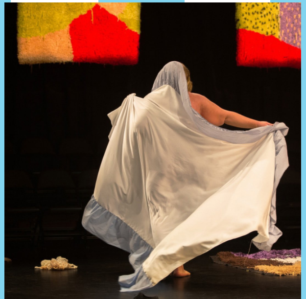
ÖH av Sonja Jokiniemi.