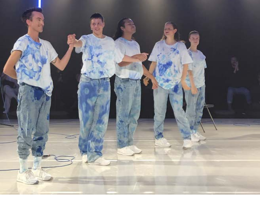
Sindri Runudde "Delighthouse and the Dark Room".