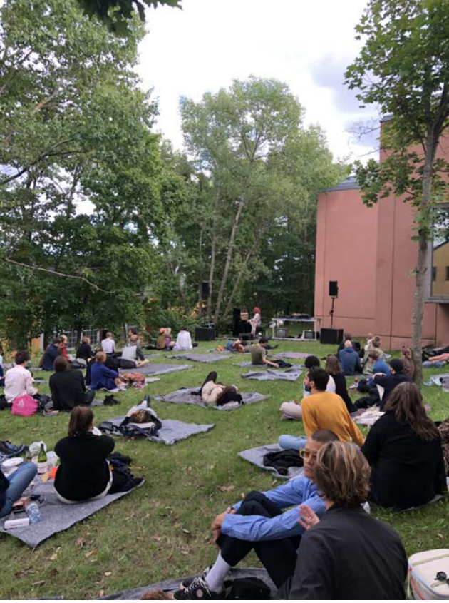
Lustholmen, en festival med konserter och dans och performance i samarbete med Anrikningsverket.