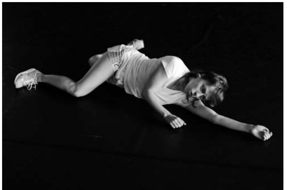
Eszter Salamon "Dance for Nothing"