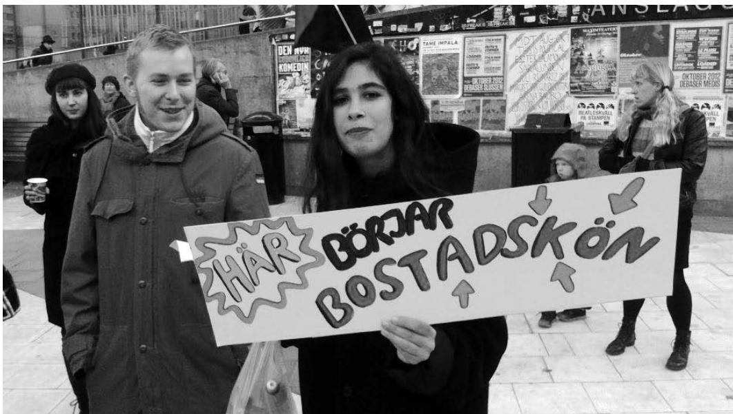
MDTs affischkampanj på anslagstavlan på Sergels torg

Under året presenterade MDT fortfarande ett stort antal föreställningar som vi inte hade de ekonomiska förutsättningarna att marknadsföra i den utsträckning vi skulle velat. Trots detta utsatta läge ser siffrorna för 2012 bra ut. En beläggning på 64%. Och en liten förlust på -57.410 kr.