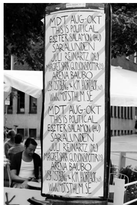
Affischkampanj på Kulturreklam-tavlor

Jämfört med 2011, då vi visade 114 föreställningar av 48 produktioner plus 20 residensvisningar/presentationer hade vi en total publik på 5.740 personer och en snittbeläggning på föreställningarna på 62 %. Vi har alltså ökat både totala antalet besökare och snittbeläggningen trots att vi presenterade något färre föreställningar.