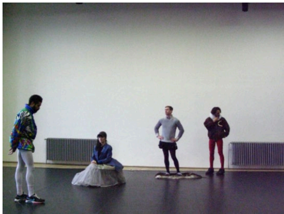
Andros Zins-Browne, The middle ages . Co-production: Kaaitheater (Brussels), Buda (Kortrijk), MDT (Stockholm), PACT Zollverein (Essen), HAU (Berlin). Coproduced by Vooruit in the frame of the European Network DNA (Departures and Arrivals). This presentation is part of the project [DNA] Departures and Arrivals, which is co-financed by the Creative Europe program of the European Commission. Co-funded by the Creative Europe Program of the European Union. In collaboration with: Departs, Stuk (Leuven), Netwerk (Aalst), wp Zimmer (Antwerp), Les Ballets C de la B (Ghent). With the support of: The Flemish Government.

Institutioner och festivaler skriver så kallade letters-of-intent där de berättar att de vill samproducera verket i fråga. Det stärker kredibiliteten för verket och kan underlätta för att få finansiering. Detta blir också som ett slags immateriellt kapital för konstnären. Arrangörer vittnar om att det är så pass viktigt för konstnärer att få dessa intentionsbrev/ letters of intent inför kontakt med bidragsgivare att själva brevet blir värdefullt i